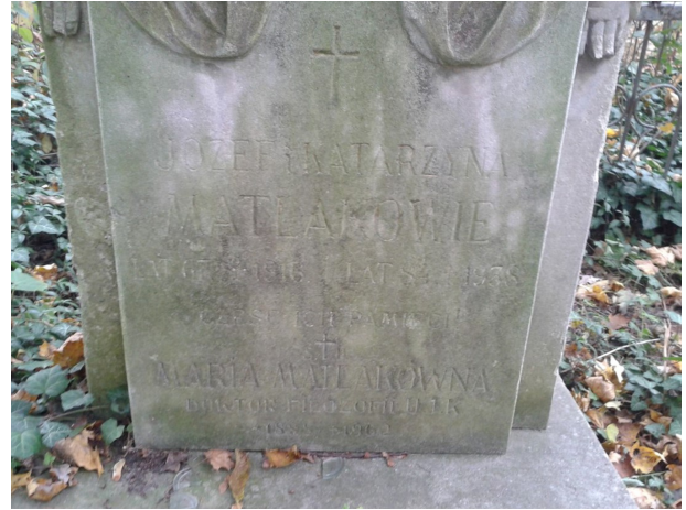
Rycina 2 Inskrypcja na nagrobku z informacją o Marii Matlakównie.